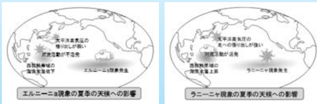
図 エルニーニョ現象、ラニーニャ現象が日本の天候に及ぼす影響

2014年夏に発生したエルニーニョ現象が2016年春に終息してからは、エルニーニョ現象もラニーニャ現象も発生していませんでしたが、今後、秋のはじめまでにエルニーニョ現象が発生する可能性があります。これからの天候については、毎週木曜日に発表する最新の1か月予報をご覧ください。