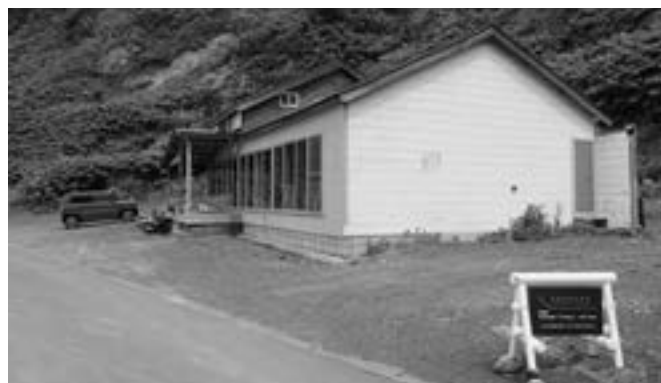
盃海水浴場にある古い民宿を改築して出店した“さかずきテラス”