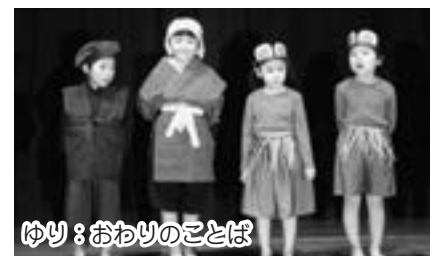
ゆり：おわりのことば