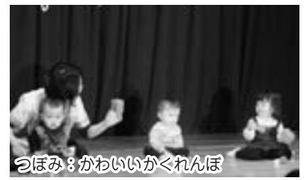
つぼみ：かわいいかくれんぼ