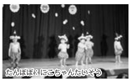
たんぼぼ：にこちゃんたいそう