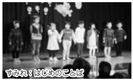
すみれ：はじめのことば

園児たちは、この日のために練習してきた歌やダンス、劇などを元気いっぱいに披露し、会場からは大きな拍手が送られていました。