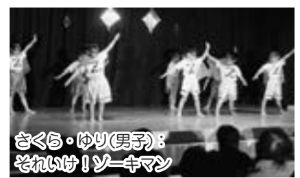
さくら・ゆり(男子)：それいけ!ゾーキマン