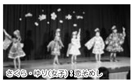
さくら・ゆり(女子)：恋ぞめし