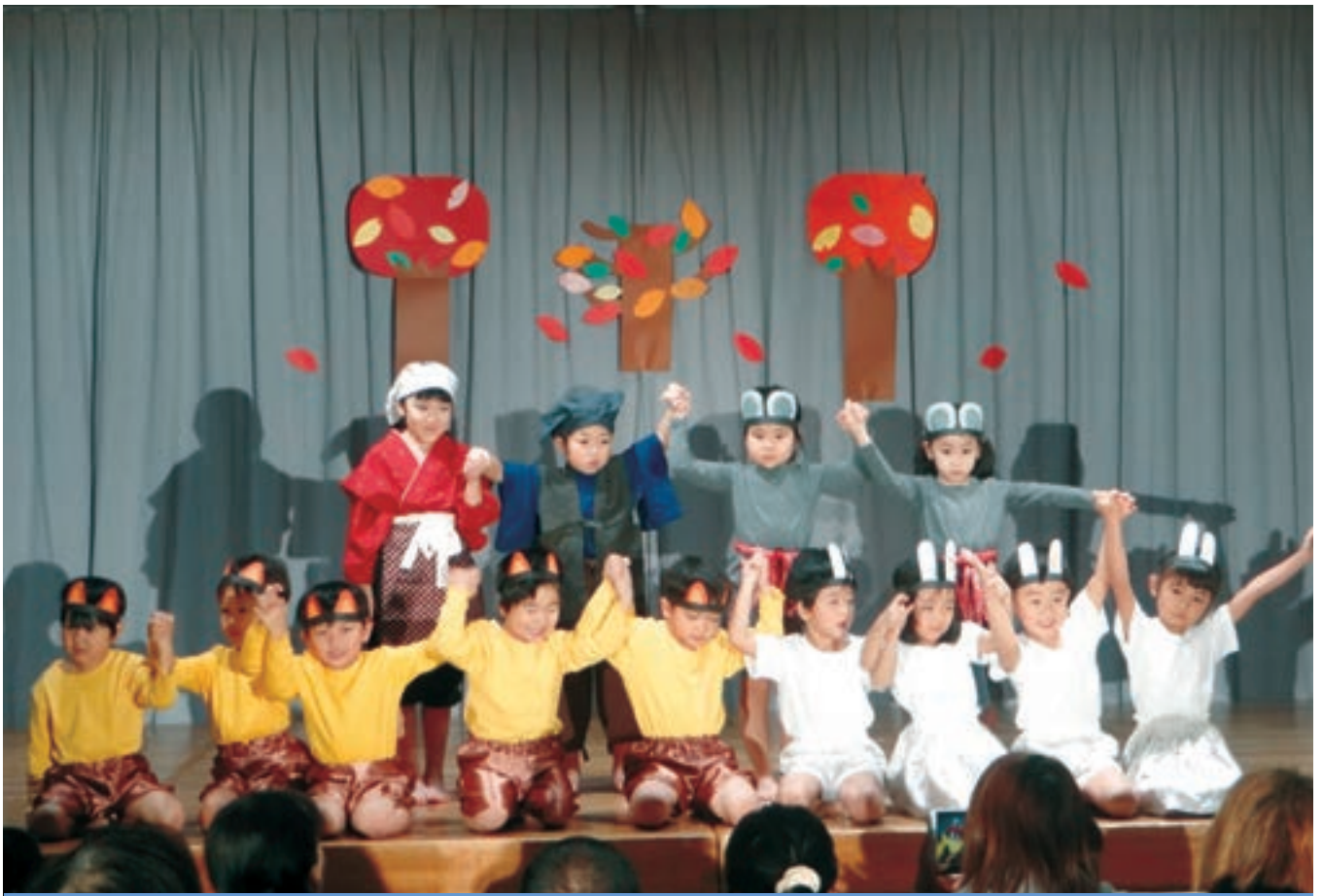
とまり保育所生活発表会 〈平成30年11月17日〉