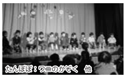
たんぼぼ：ワニのかぞく 他