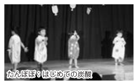
たんぼぼ：はじめの炭酸