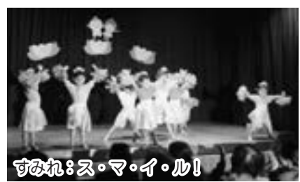
すみれ：ス・マ・イ・ル!