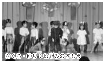
さくら・ゆり：ねぞみのすもう