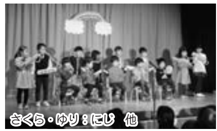
さくら・ゆり：にじ 他