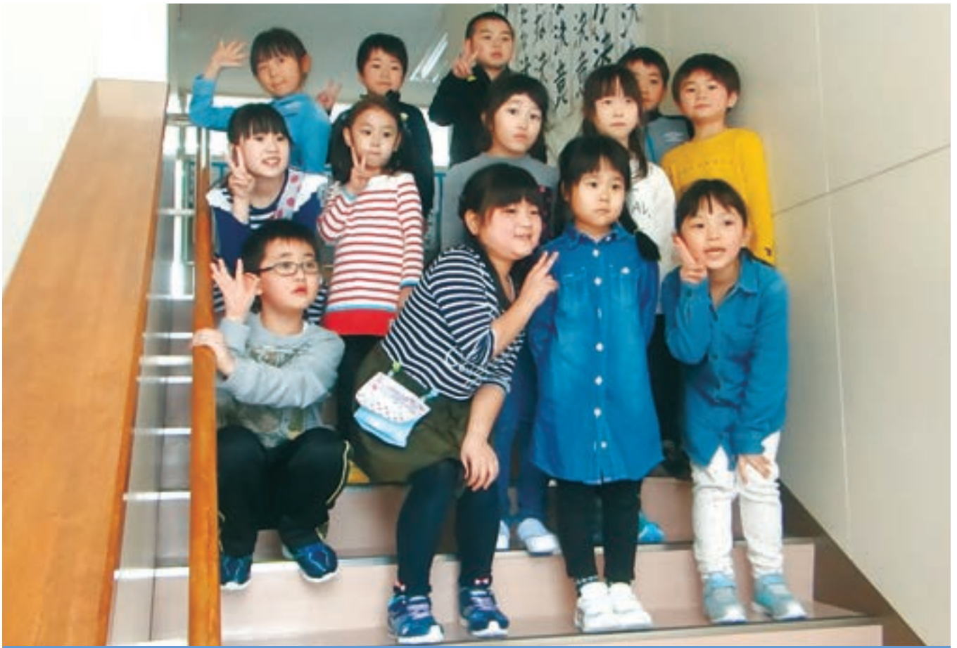
泊小学校新入生一日入学 〈平成31年2月7日〉