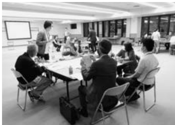
（ワークショップの様子）