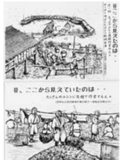
古写真と写した窓絵

窓ガラスに貼ってありますので、透かして外の海景色と重ねて見ると当時の賑わいも聞こえてくるような気がしますがいかがでしょうか。