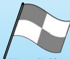
津波フラッグのデザイン