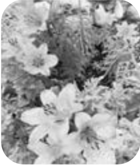
エゾスカシユリ 客殿前に咲く泊村の花

5月23日に再度開館し、初日から入館者もあり、いつもの鯉御殿にもどりつつある、とお知らせしたいですが、現実はなかなか難しいようです。昨年ですと道外の方々と団体が入館者の半数以上でしたので、まだ海外や道外との交流が自粛されている間はどうしても入館者数は押さえられてしまうのは仕方のないことと考えます。そんな時に「新聞や広報で見ました」「以前来て良かったので家族も連れて来ました」「オープンを楽しみに待っていました」という方々の来館はうれしいものです。ちょうど泊村の花も綺麗に咲きました。