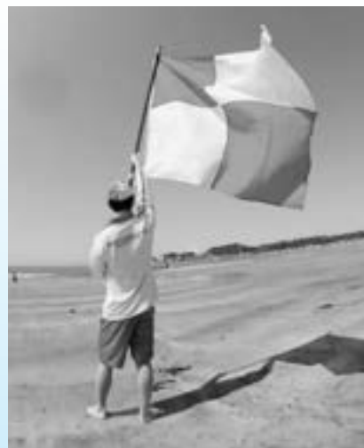
「赤と白の格子模様」の旗（U旗）を用いた津波警報等の伝達（イメージ）

津波フラッグ（赤白格子模様の旗）は、国際信号旗の「貴船の進路に危険あり」を意味するU旗と同様のデザインです。U旗は、海外では海からの緊急避難を知らせる旗として多く用いられています。