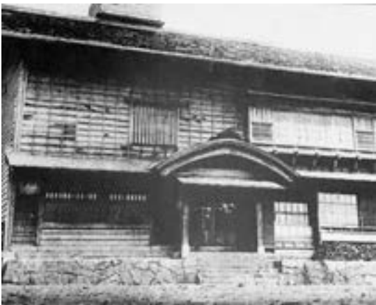
旧川村番屋（修復後）

今回紹介するのは、写真展示についてです。館内に展示されているのはパネル・掲示物合わせて50点ほど。小さな写真パネルは資料室に50点以上（かつて泊小学校で展示）古写真のデータはCDにもあります。昨年番屋2階に展示されている写真パネル（旧川村番屋と旧田中漁場）の二点の傷みが進んでおり、剥落が1～5cm幅で、展示物としてはお見せ出来ない状態だったのでその二点は、はずしておりました。このたび修復してみましたのでお越しになった際にはぜひともご覧になってください。