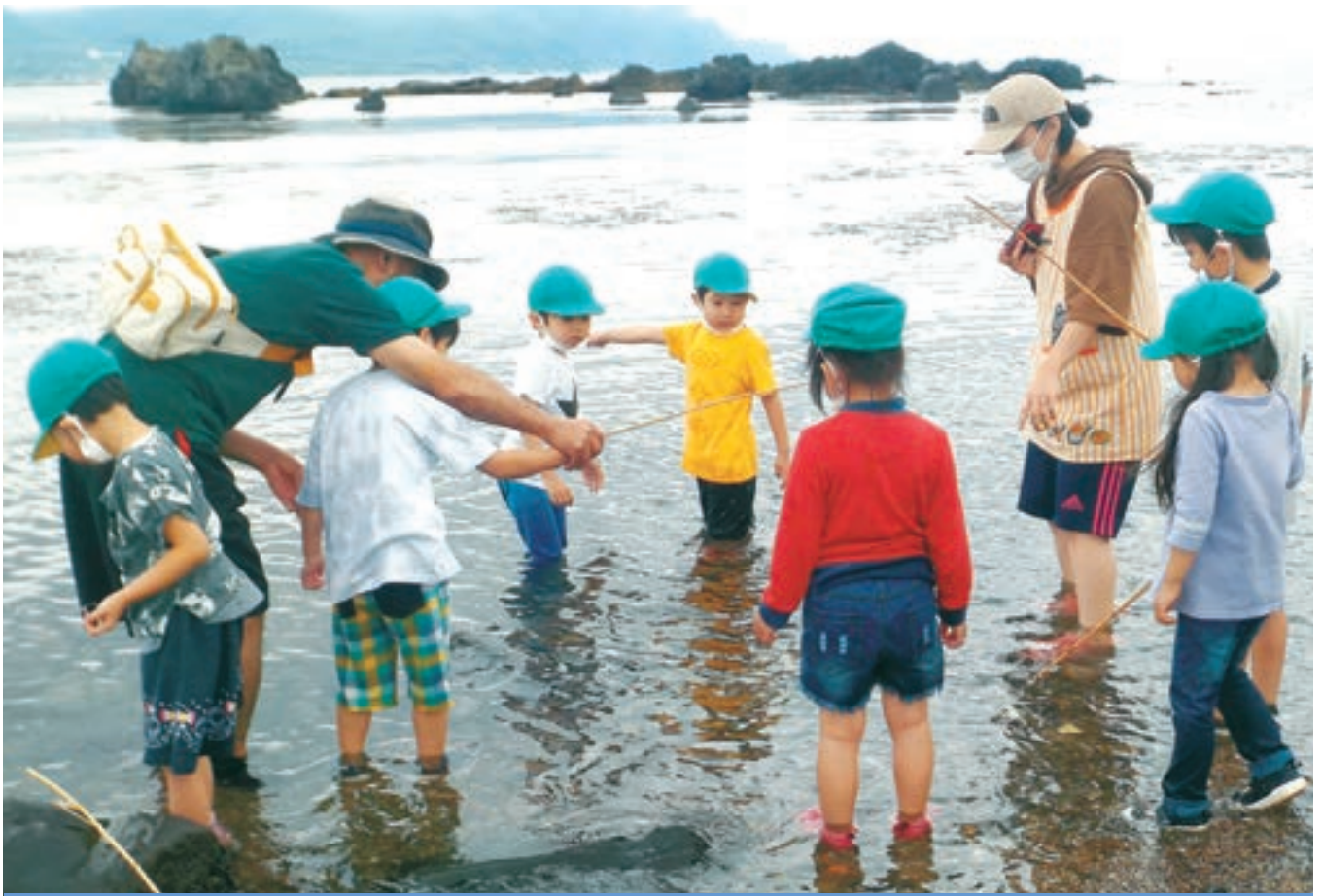
とまり保育所 春の遠足 〈令和2年6月19日〉