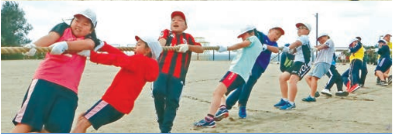
(上段)とまり保育所うんどう会 〈9月12日〉/(下段)泊小学校運動会 〈9月19日〉