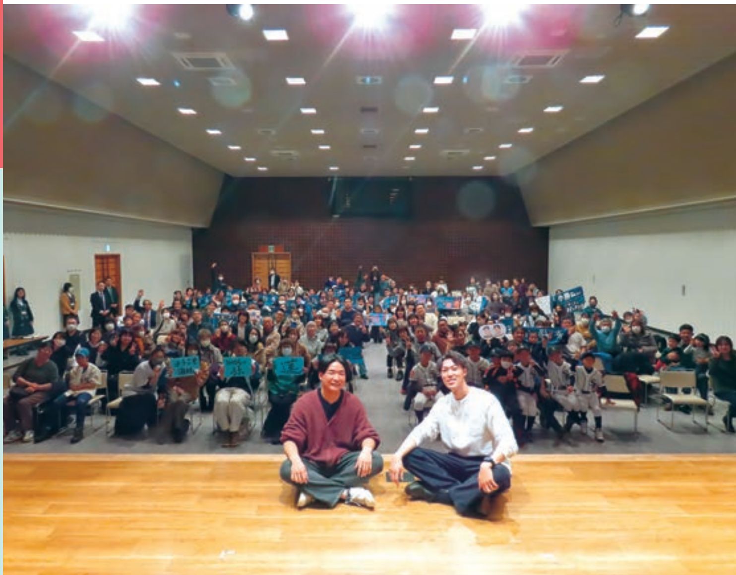
北海道日本ハムファイターズ応援大使プロジェクト 選手交流会 2025