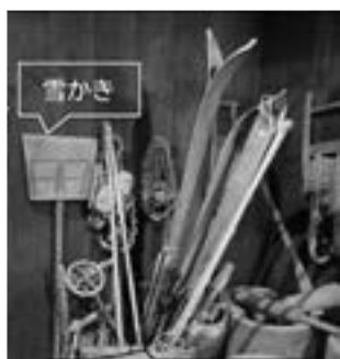
スキー・竹製ストック

今ではプラスチック製の軽くて大きなものに取り替わりましたが、私の子どもの頃にはさらさら雪をかくのに使われていました。雪が付かないように表面にロウを塗ったりしていたように思います。2つ目は、“カンジキ”。館内に3つ4つありました。除雪車や除雪機がなかった頃、長靴では埋まってしまう厚い雪の上を歩く時に足につけた道具です。今でも深雪の山を歩く時に使われているようです。桑やタモの木を使用して、歩きやすいように先をそらせたもの、すべり止めのためにつめをつけたものもあったようです。そして3つ