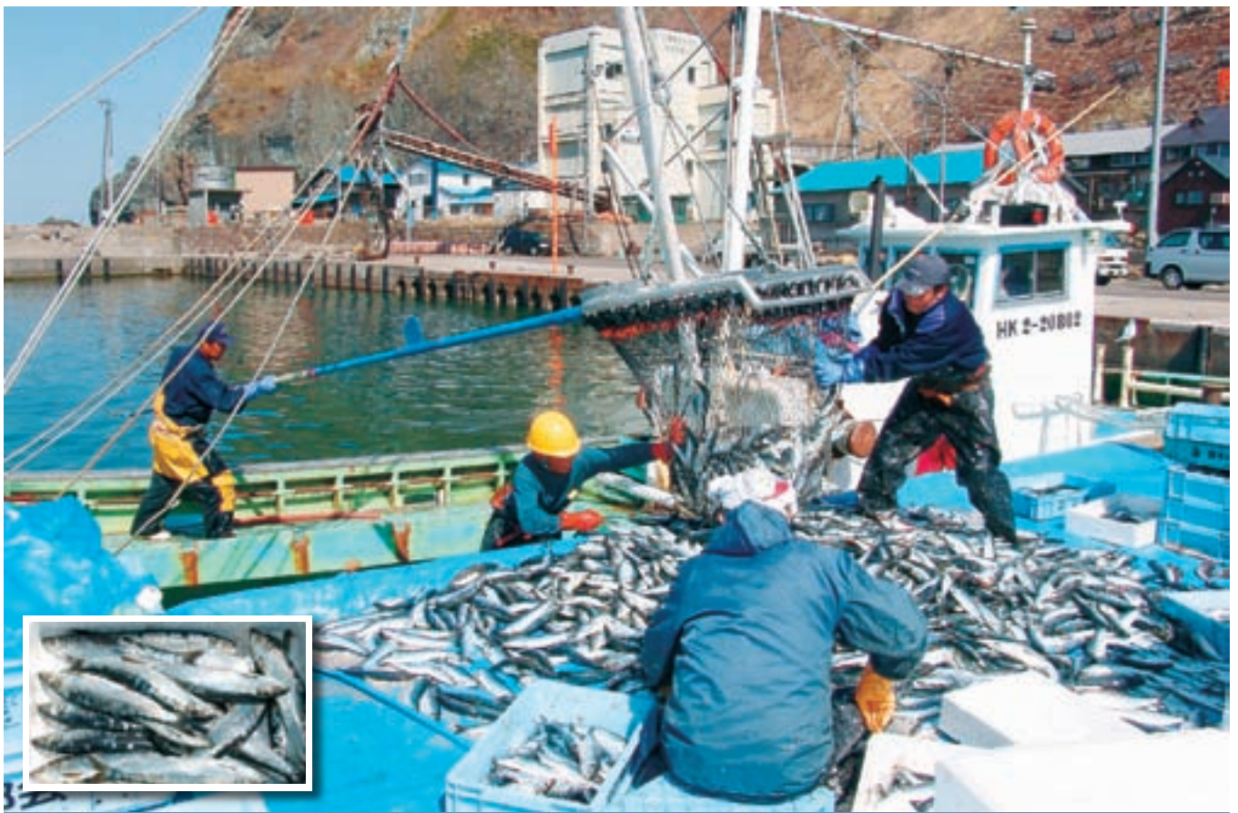
鯨大漁 (平成23年4月12日)