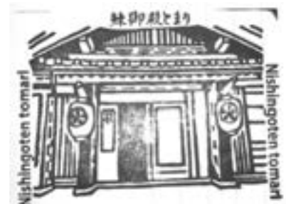
『鯉御殿とまり』のスタンプができました

明治30年代になると電信という通信手段の普及、東京ー青森間の東北本線の開通、汽船の普及により北前船はどんどん姿を消し、日露戦争で北海道周辺の海が危険になったことから、北前船の長い歴史はピリオドを打つこととなります。