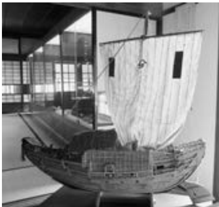
番屋の『北前船の模型』

採れたてのタケノコやフキは大きな鍋で茹でられ、家族総出で皮むきやスジ取りをしました。タケノコのとっぺんを折らずに誰が上手に皮むきできるか競争したこと、フキで黒くなった手を心配したことを懐かしく思い出します。