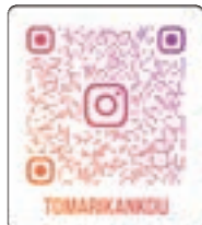
泊村観光協会 公式Instagram & Facebook