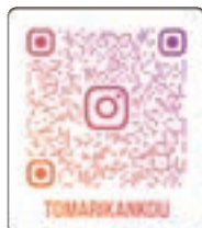
泊村観光協会 公式Instagram & Facebook