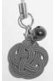
今年の来館記念 水引の梅結び

6月は和名で“みなづき”といいます。本州の方では梅雨の時期なのに、水が無い月と書きます。旧暦では梅雨明け後にあたるので「水の無い月」の名がついたという説と、逆に「無」は「無い」という意味ではなく連体助詞「の」を意味していて、「水の月(田に水を引く月)」に由来するという説があります。いずれにしても、田植え後の水をたたえた瑞々しい緑の田が目に見え、ちなみに、氷の角を表現した三角形の白色のういろうに甘く煮た小豆をのせた“水無月”という和菓子を思い出した方はおりませんか。京都では6月30日「夏越の祓」に“暑気払い”や“厄除け”の意を含め、残り半年の無病息災を祈願して食べる風習があるそうです。泊村も6月に入り、ウニ漁やお祭りが始まります。今年もにぎやかな夏が到来しました。