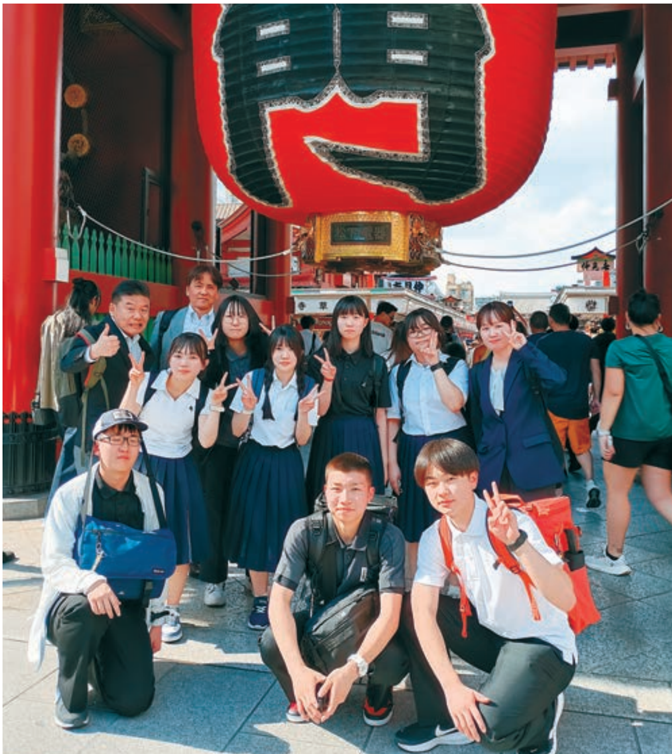
泊中学校3年生修学旅行(5月13日~15日)