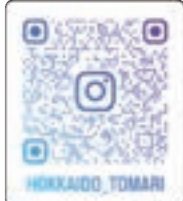
泊村 公式Instagram & Facebook