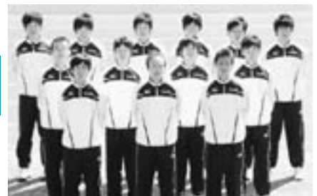
●ゲストランナー 三菱重工マラソン部