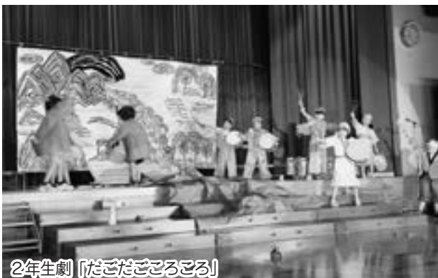
2年生劇「だだだごころころ」