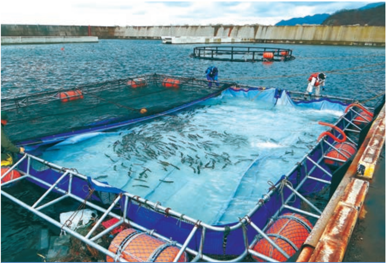
トラウトサーモン養殖試験事業着手 〈令和3年11月15日〉