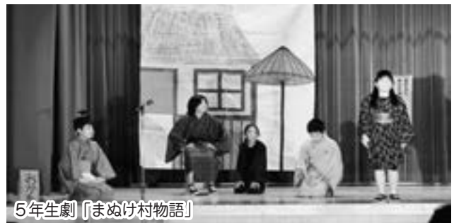
5年生劇「まぬけ村物語」