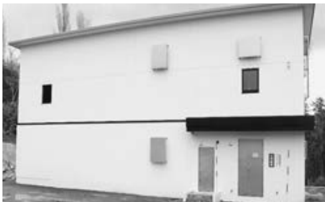
泊浄水場前処理施設全景

泊村では、平成29年度に策定した「簡易水道施設更新基本計画」を基に水道施設の改修事業を行っております。この度、電源立地地域対策交付金を活用し、泊浄水場の敷地内に新たに前処理施設を、令和2年6月に着工し、令和3年10月に完成しました。