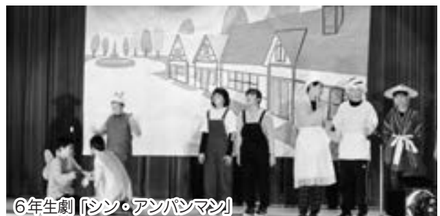
6年生劇「シン・アンパンマン」