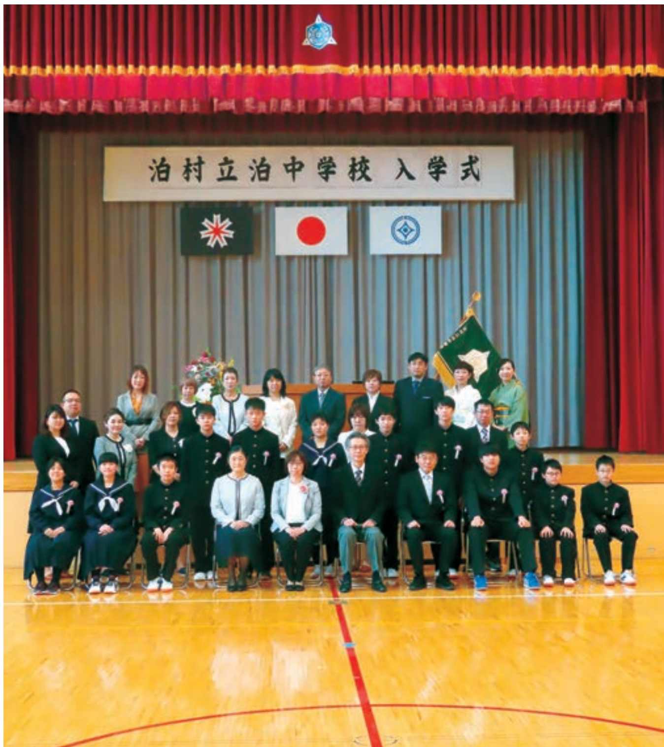
泊中学校入学式（令和4年4月7日）