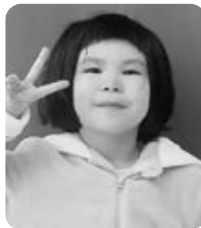
ひらたにこちゃん