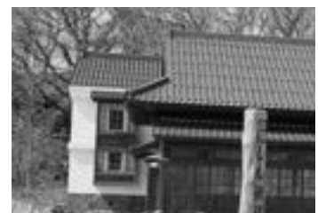
客殿と石倉と神社と灯台と。