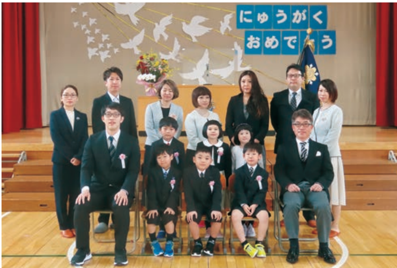
泊小学校入学式 (令和4年4月6日)