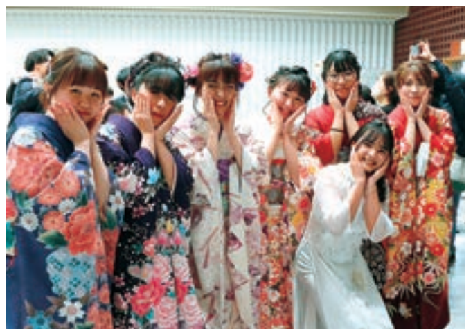
令和5年 二十歳のつどい (1月8日)