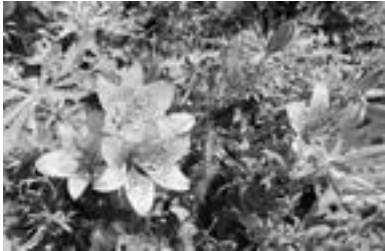
真上から撮ったエゾスカシユリ

『鯧御殿とまり』のエゾスカシユリが今年も満開です。青空を見上げて笑っているように咲く朱色の花が泊村に夏を連れてきたようです。今春生まれの雀の子が巣から降りてきて、親鳥から餌をもらっているかわいらしい姿も見られる季節になりました。