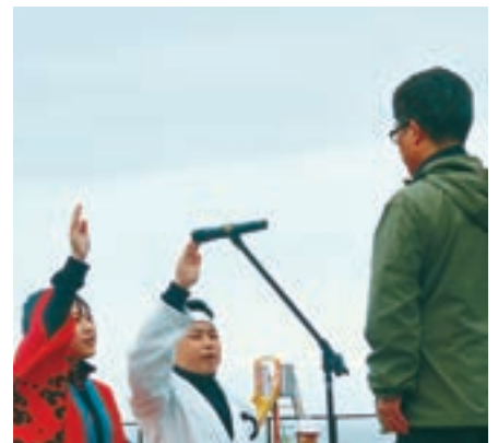
第28回泊小学校大運動会（6月3日）