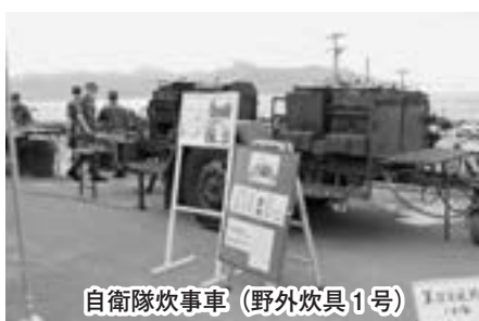
自衛隊炊事車（野炊具1号）