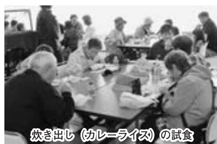
炊き出し（カレーライス）の試食