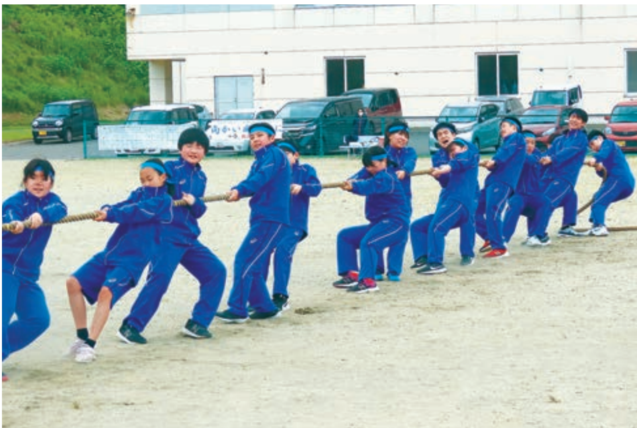
泊中学校 陸上記録会 (6月2日)