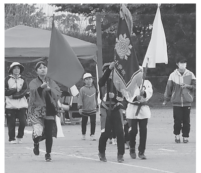
泊小学校大運動会

今年のテーマ「チームで協力して最後までがんばろう」を掲げ、小雨の降る中でしたが、たくさん保護者や家族の声援を受けて、児童全員が最後まで精一杯の頑張りをを見せてくれました。