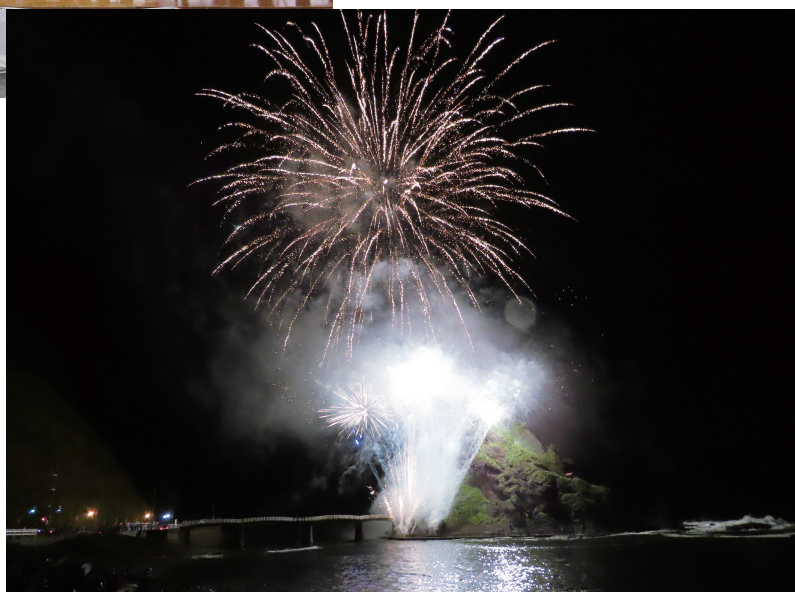
第52回群衆まつり（令和5年7月15日：茂岩海岸）