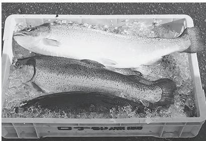
水揚げされたトラウトサーモン

しかし、まだ魚の需要に対して、供給量が足りない状況であることから、本年度においても、養殖事業の拡大を図り、事業化に向けて養殖事業を引き続き実施してまいります。