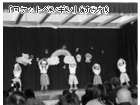
「ロケットペンギン」(すみれ)