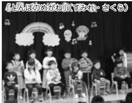
「とんぼのめがね」(すみれ・さくら)