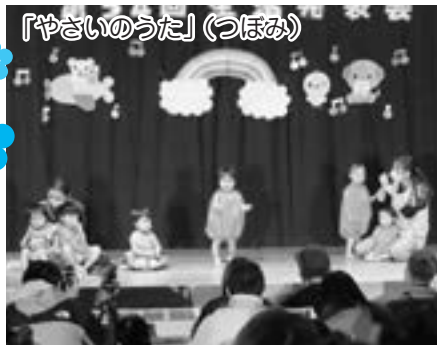
「やさいのうた」(つほみ)

園児たちは、この日のために練習してきた歌やダンス、劇などを元気いっぱいに披露し、会場からは大きな拍手が送られていました。