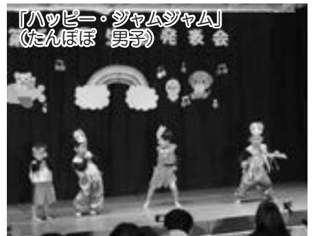
「ハッピー・ジャムジャム」 (たんぼぼ 男子)