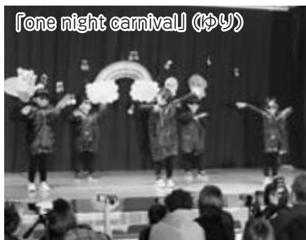
「one night carnival」(ゆり)