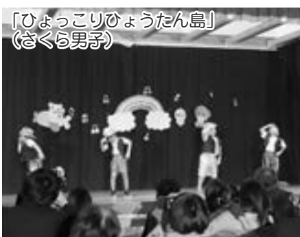
「ひょっこりひょうたん島」 (さくら男子)