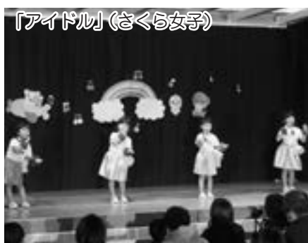
「アイドル」(さくら女子)