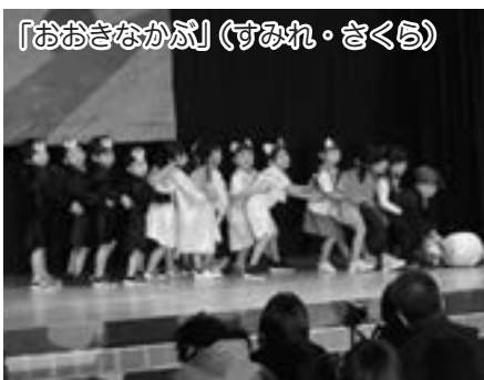
「おおきなかぶ」(すみれ・さくら)