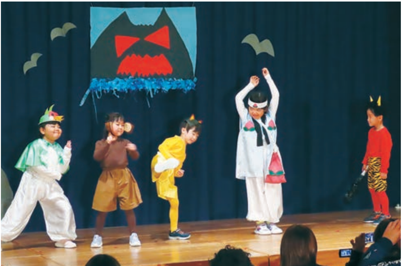
とまり保育所 生活発表会 (11月18日)

・お休み中の急を要する用件については、日直にご連絡下さい。 電話番号 75-2021