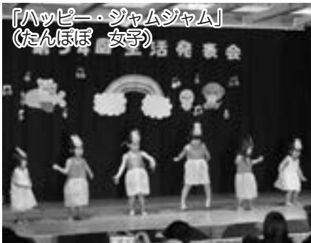
「ハッピー・ジャムジャム」 (たんぼぼ 女子)