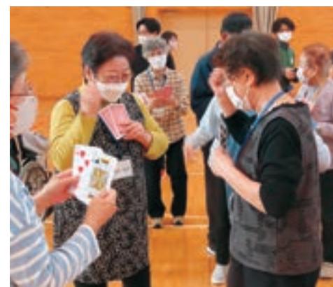
ねんりんピックとまり2023 (10月27日)