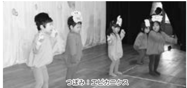
つぼみ：エビカニクス