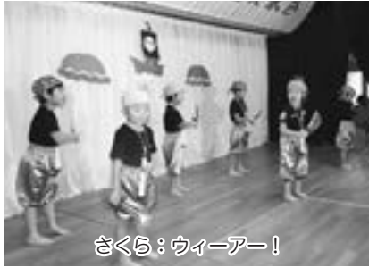
さくら：ウィーアー!