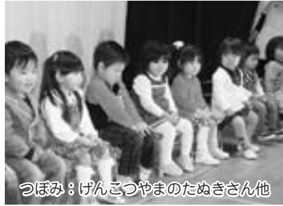
つぼみ：げんこつやまのたぬきさん他