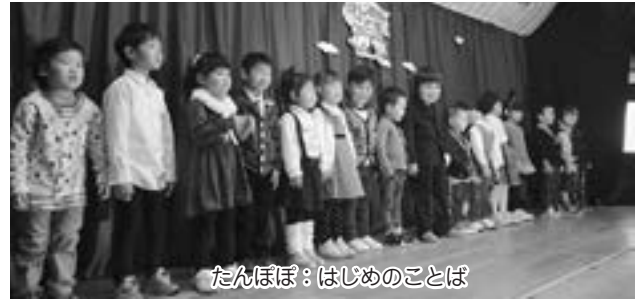
たんぼぼ：はじめのことは