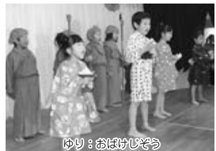
ゆり：おぼけじどう