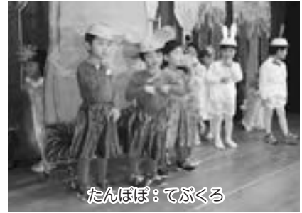
たんぼぼ：てがくろ