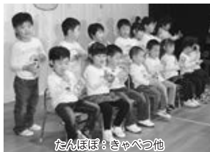
たんぼぼ：きゃべつ他