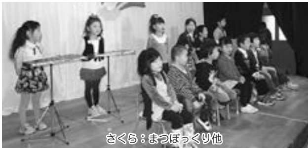
さくら：まつぼっくり他